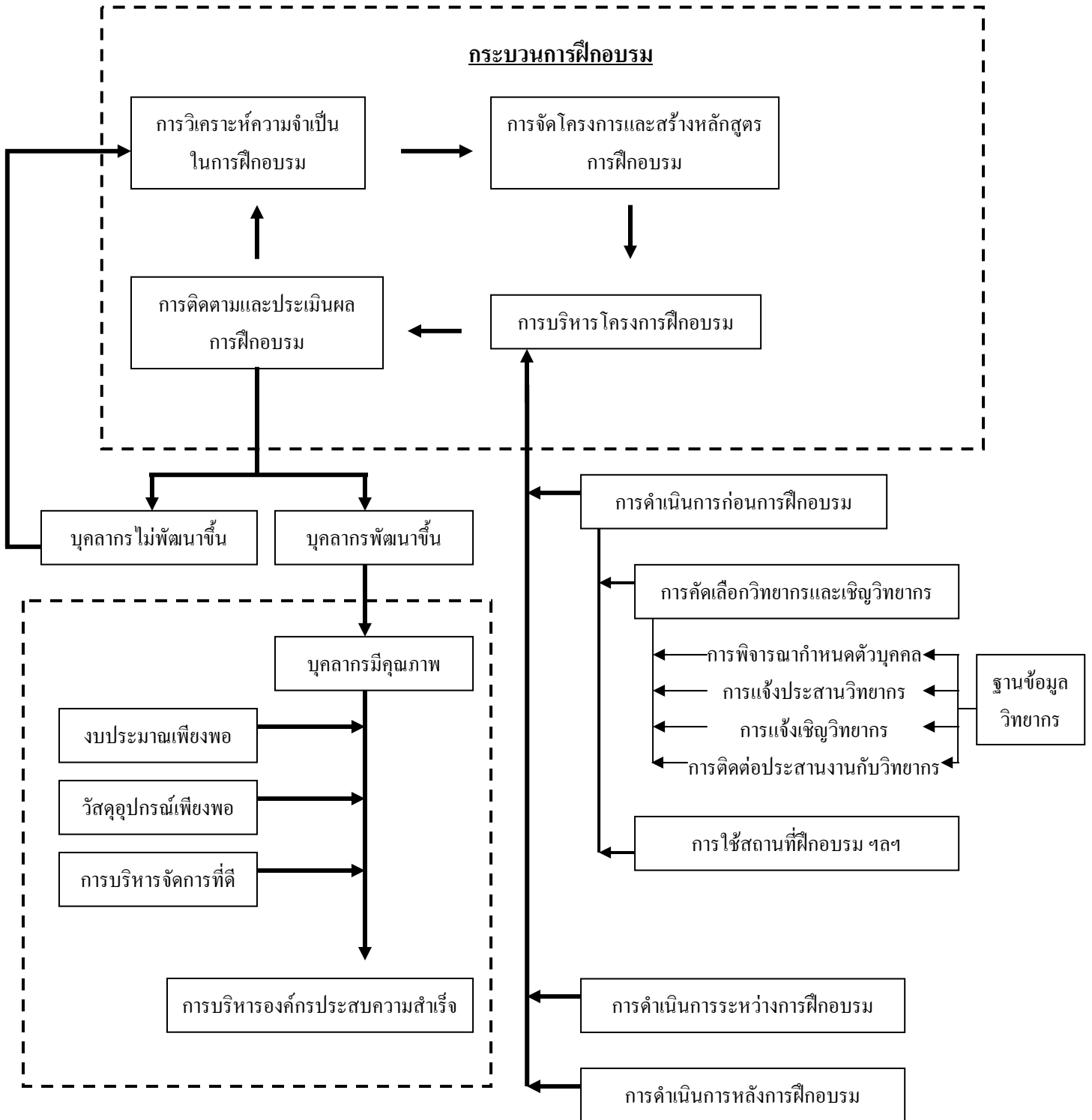
แผนภาพที่ 2 แสดงกรอบแนวคิดในการศึกษา

เป็นกรอบแนวคิดที่ใช้ในการแสดงถึงความสัมพันธ์ของฐานข้อมูลวิทยากรต่อกระบวนการฝึกอบรม ทั้งนี้ เพื่อช่วยให้เกิดความเข้าใจถึงฐานข้อมูลวิทยากร ซึ่งเป็นส่วนหนึ่งที่มีความสำคัญต่อกระบวนการฝึกอบรมให้บรรลุเป้าหมายและมีประสิทธิภาพ มีผลสัมฤทธิ์ต่อการบริหารองค์กร